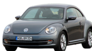
BEETLE / COCCINELLE