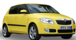
FABIA II (54) 2013-2018