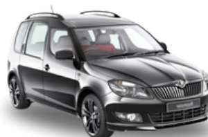
ROOMSTER (5J) 2013-2015