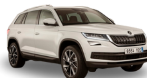
KODIAQ EU (NS) 2017-2018