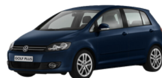
GOLF/ GOLF PLUS