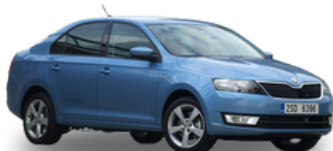
RAPID EU (NH) 2013-2018