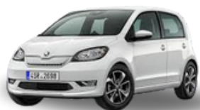
CITIGO (NF) 2013-2018

ARRÊT DE CIRCULATION & REPARATION GRATUITE