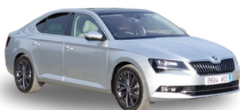
SUPERB III (3V) 2015-2018