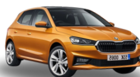
FABIA III (NJ) 2015-2018