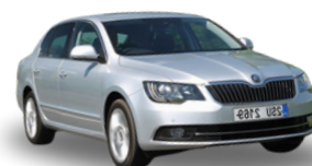
SUPERB II (3T) 2014-2015