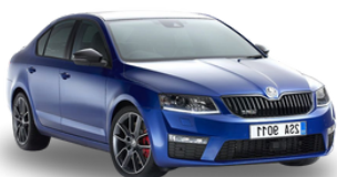
OCTAVIA III (5e) 2013-2018