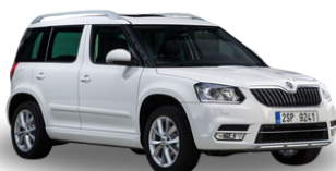
YETI (5L) 2014-2017